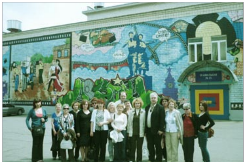
Поездка в Москву (у Мосфильма)

В 2011 г. по линии обкома Профсоюза льготные санаторно-курортные путевки в профкоме получили двое сотрудников. Также обкомом были выделены для детей сотрудников две бесплатные путевки в санатории.