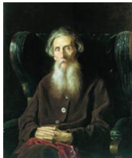
В.И. Даль. Портрет работы В.Г. Перова

В Нижнем Новгороде В.И. Даль не занимался медициной, но, будучи добрым человеком, старался помочь людям. Во время частных выездов деревень он оказывал посильную медицинскую помощь крестья-